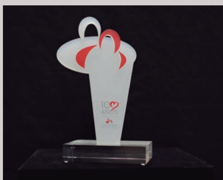
Centenario de la Residencia de La Caridad Reconocimiento a la Fundación Caja Cantabria

Esta red de espacios da soporte a una actividad intensa, de servicio a la sociedad, que desarrolla su acción bajo parámetros de transparencia, eficiencia y pluralidad.